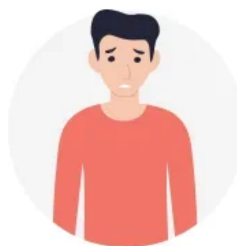
ПОТЕРЯ ИНТЕРЕСА К ЛЮБИМЫМ ЗАНЯТИЯМ