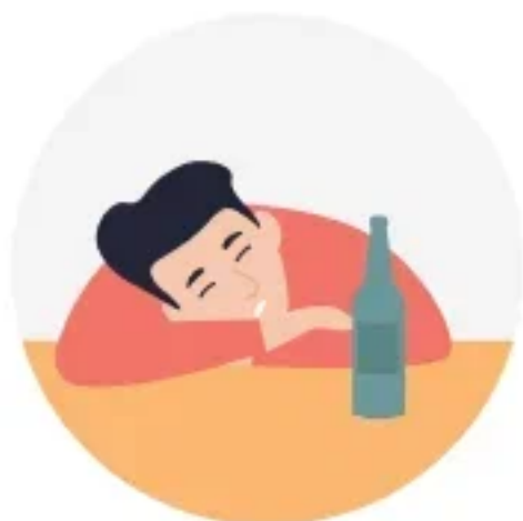
ВЫПИВКА В ОДИНОЧКУ