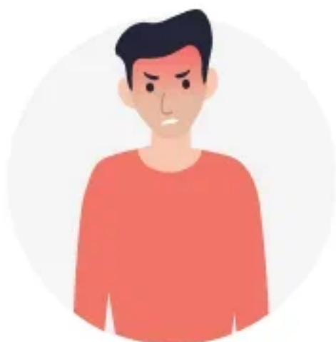
АГРЕССИЯ ПО ОТНОШЕНИЮ К БЛИЗКИМ