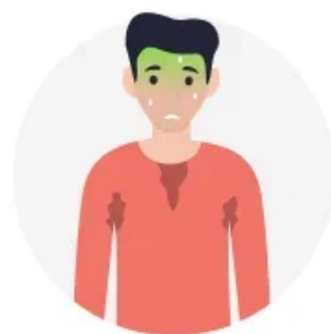
ПРОБЛЕМЫ СО ЗДОРОВЬЕМ