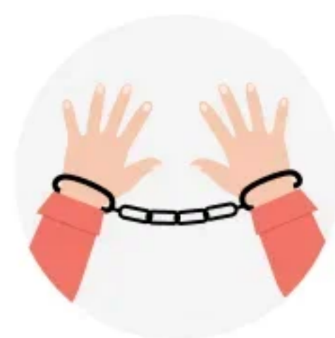
ПРОБЛЕМЫ С ЗАКОНОМ И НА РАБОТЕ